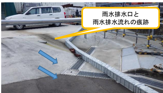
(写真 4 - 1) ホールドアップ建屋西側の側溝整備状況とフェーシング施工箇所における勾配確保状況（排水痕跡を確認）