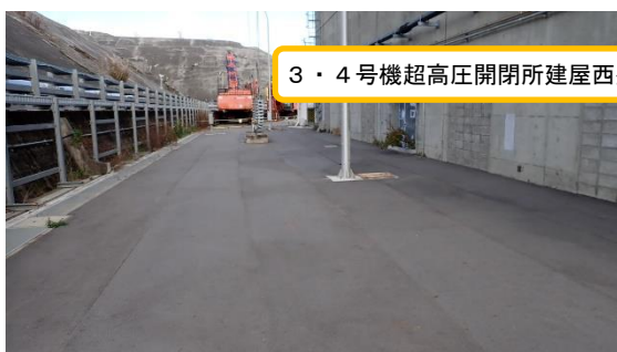
(写真 3 - 1)