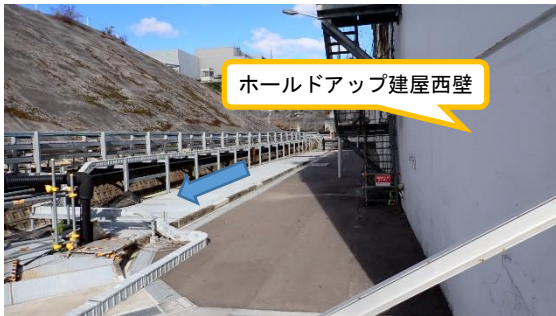
(写真 3 - 3) ホールドアップ建屋西側のフェーシング状況と新設排水溝（完了済）