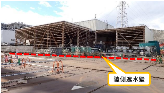
(写真1-1) 3・4号機超高压開閉所建屋の概観 (北東側から撮影)