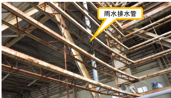
(写真 2 - 2)