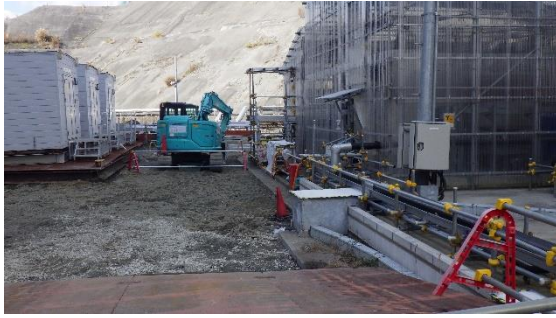
(写真 3 - 2) 3・4号機超高圧開閉所建屋南西側のフェーシング状況（一部未完） （共用プールと開閉所の間隙部）