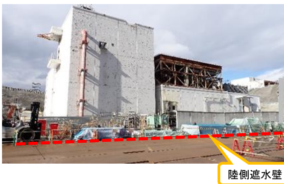
(写真1-2) ホールドアップ建屋の概観 (南東側から撮影)