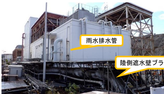
(写真 2 - 3)