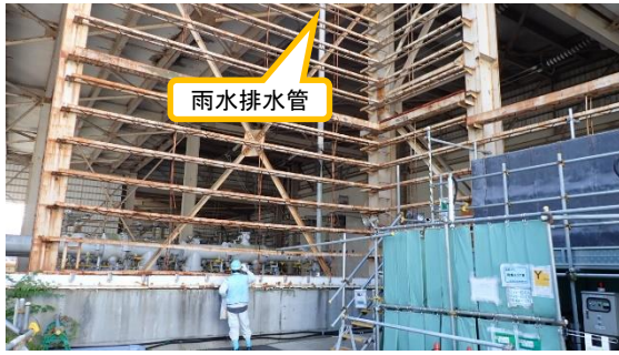
(写真 2 - 1)