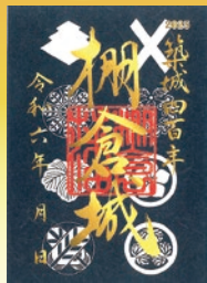
築城400年記念御城印