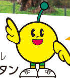
福島県復興シンボル キャラクターキビタン