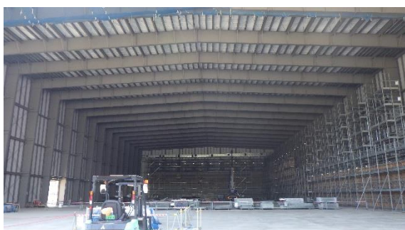
(写真 1 ③) 第 10-C 棟内部