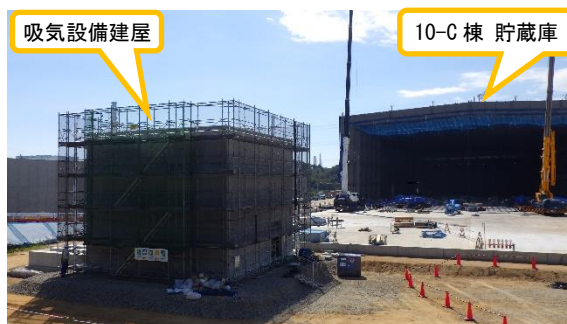
(写真 2) 吸気設備建屋