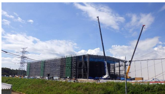
(写真 1 ①) 第 10-C 棟外観