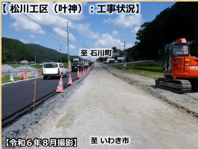
【松川工区（叶神）：工事状況】