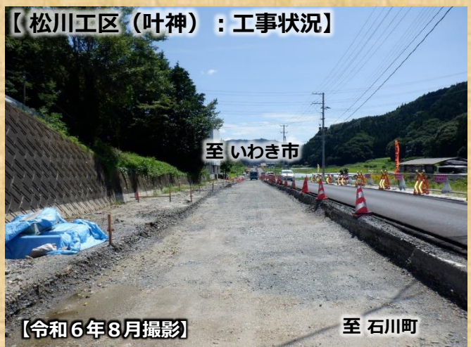
【松川工区（叶神）：工事状況】