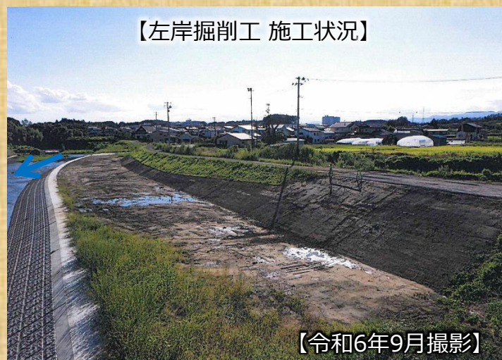
【左岸掘削工 施工状況】