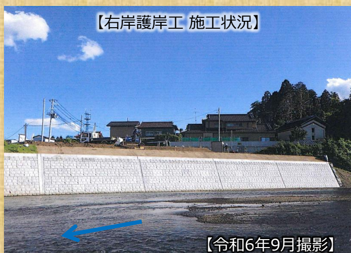
【右岸護岸工 施工状況】