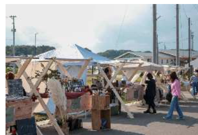
飲食店・珈琲店・雑貨店が集まり開催された マルシェ「満穂(みおん)」