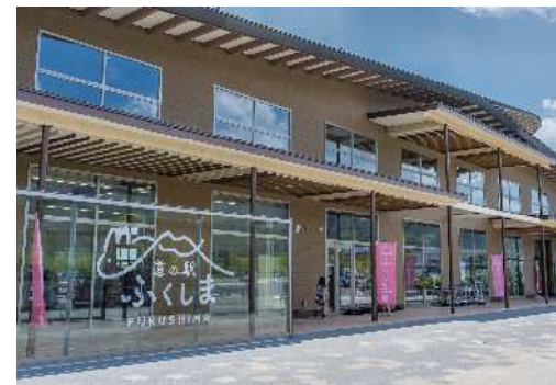
📍 道の駅ふくしま 📍 福島県福島市大笹生月崎1-1