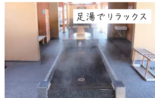
📍 旧堀切邸 📍 福島県福島市飯坂町東滝ノ町16-16