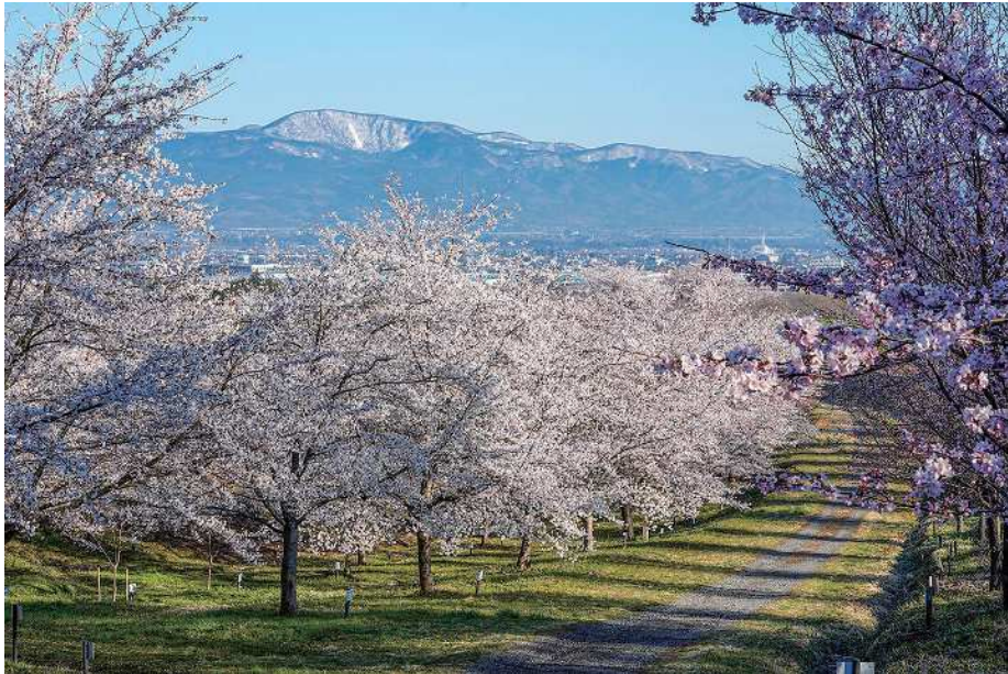
🏠 紅屋峠千本桜 📍 福島県伊達市保原町所沢東畑100