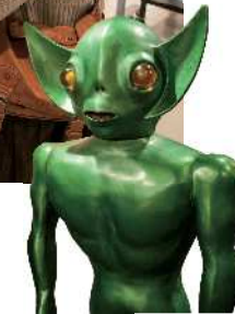
📍 UFOふれあい館 📍 福島県福島市飯野町青木小手神森1-299