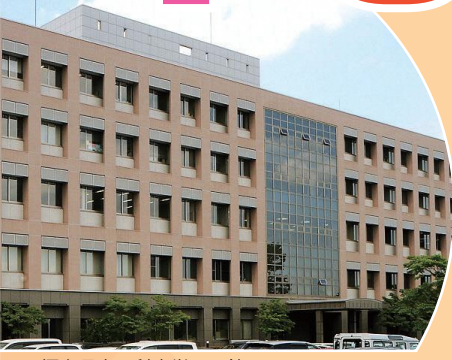
福島県立医科大学 8号館