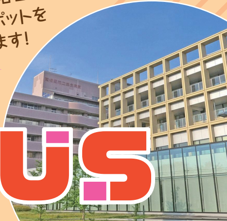
南相馬市立総合病院

浜通り・会津地方・中通りの各エリアの医療機関と各エリアのとおきのスポットをめぐるバスツアーを開催します!