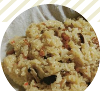
会津地鶏の焼き鳥、おこわ ほか