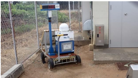
(写真 1 - 3) モニタリングポストNo. 2 に設置され た線量表示器