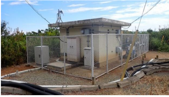
(写真 1 - 1) モニタリングポストNo. 1