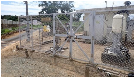
(写真 1 - 2) モニタリングポストNo. 2