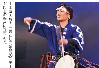
山木屋太鼓の一員として年間30ステージ以上の舞台に立ちます。

インタビューの様子はYouTube動画でも配信しています。右の二次元コードからご覧ください。