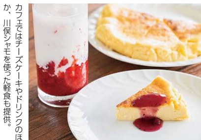
カフェではチーズケーキやドリンクのほか、川俣シャモを使った軽食も提供。