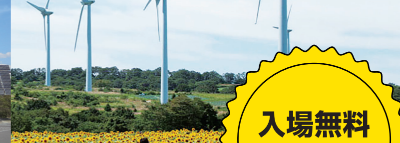
布引高原風力発電所