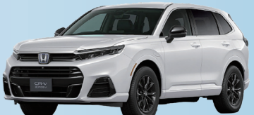
ホンダ CR-V e:FCEV