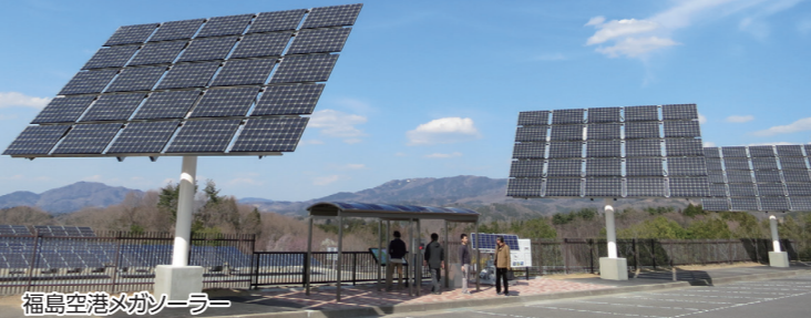
福島空港メガソーラー