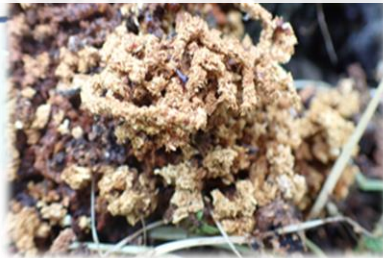
排出されたかりんとう状のフラス