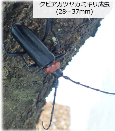
クビアカツヤカミキリ成虫 (28~37mm)