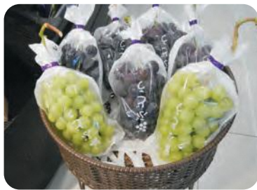
店頭販売されたブドウ

果樹では、ミカンやユズ等、地域の特産品の振興のほか、新しい品目の導入を図っています。平成27年より川内村で取り組んでいるブドウのハウス栽培の実証では、本年度立派なブドウが実り、地元直売所等へ初出荷しました。ブドウ栽培の取り組みは地域へ拡がりを見せています。