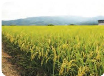
川内村の「里山のつぶ」

また、中山間地向けのオリジナル品種「里山のつぶ」がデビュー、川内村や葛尾村で栽培されました。県内のスーパーマーケット等で販売されています。ぜひお召し上がりください。