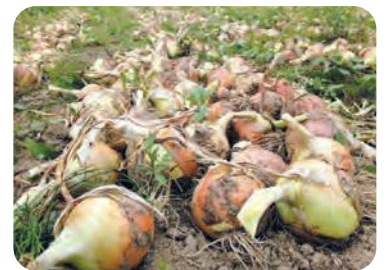
機械化体系でのタマネギ