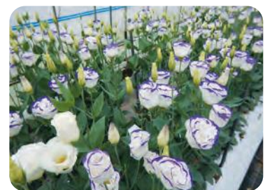
収穫を待つトルコギキョウ

管内では風評被害のない花き栽培に新たにに取り組む農業者が徐々に増えています。主な品目は、トルコギキョウ、リンドウ、コギクなどで、特にハウス栽培のトルコギキョウは、平坦部から山間部まで生産が拡がっており、秋冬期間はストックやカンパニュラの栽培も行われています。