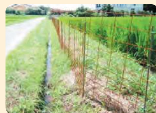
ワイヤーメッシュ柵