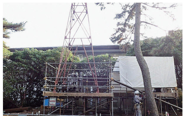
ボーリング調査の状況

敷地内の高台エリアの地点を第1候補地点（檜葉町と富岡町の境界線が候補地の中央を通る）としてボーリングによる地盤調査を実施した結果、安定した岩盤（富岡層）が確認された。