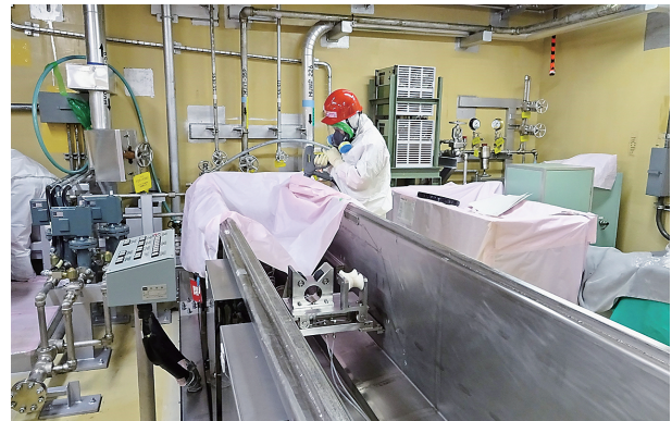
汚染の除去作業状況

また、令和4年度からは放射化汚染や二次的な汚染の状況の調査、管理区域外設備の解体撤去が進められている。