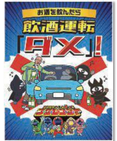
福島県交通対策協議会