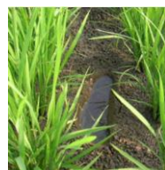
飽水管理の目安