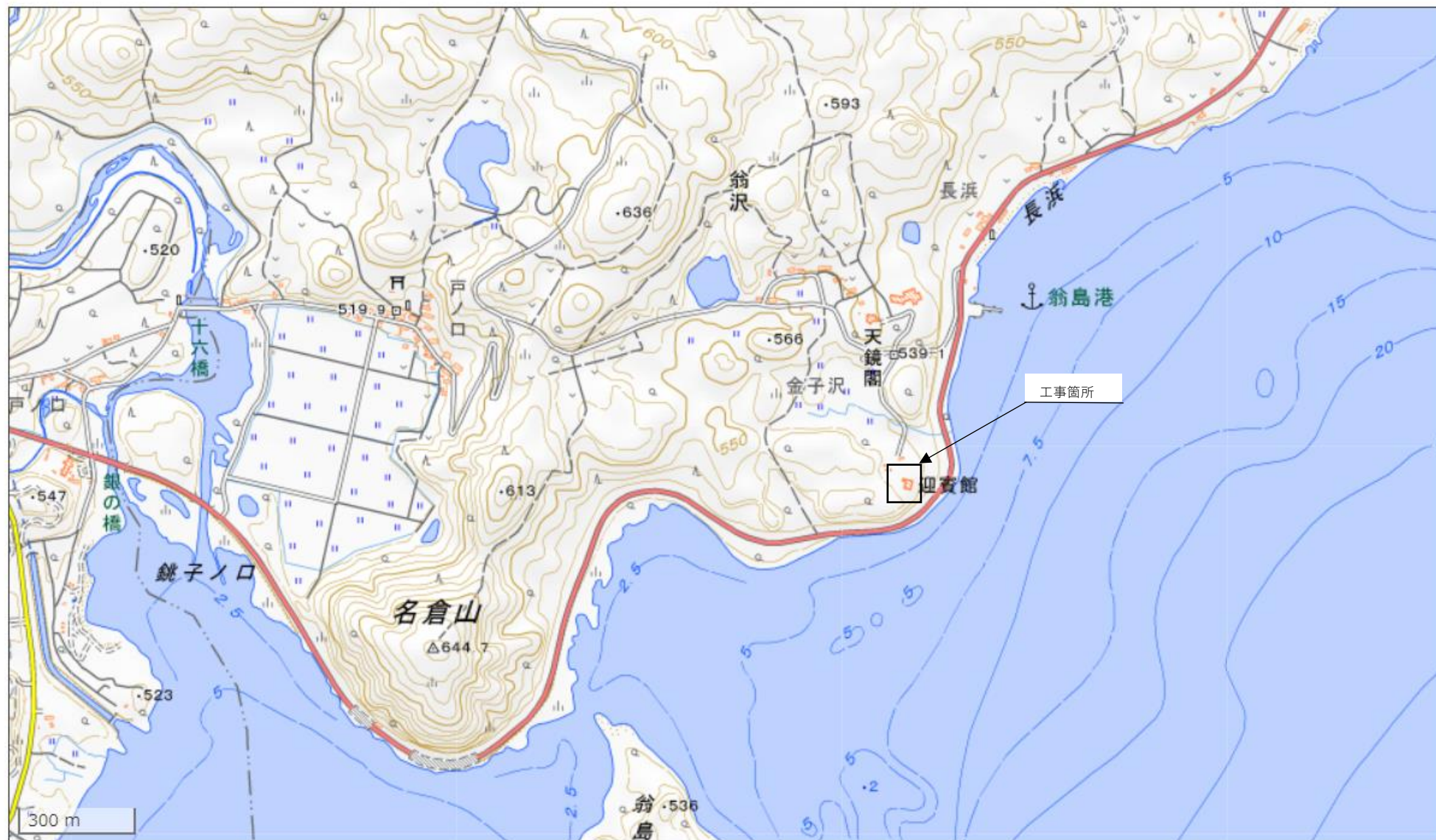
国土地理院ウェブサイトをもとに福島県作成