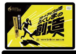
公式ウェブサイト