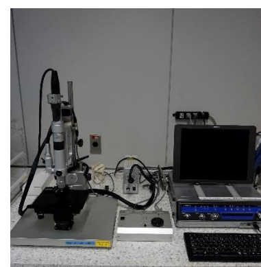
マイクロスコープ (1,440円/時間)