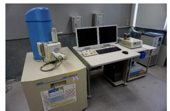
走査型電子顕微鏡 (5,650円/時間)

○その他の施設・設備は、福島県ハイテックプラザ 施設・設備データベースからご覧いただけます。