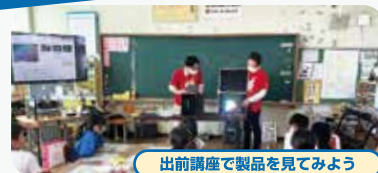
出前講座で製品を見てみよう