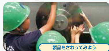
製品をさわってみよう