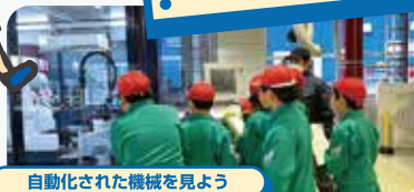
自動化された機械を見よう