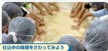
仕込中の味噌をさわってみよう