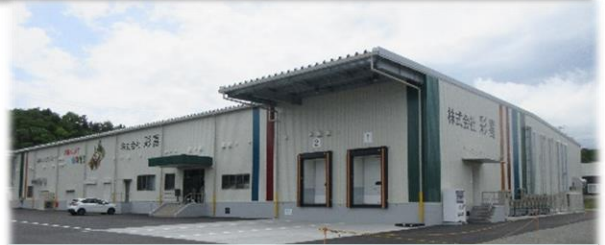
福島広域野菜加工工場 外観