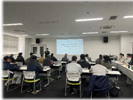
法人等向け研修会 令和 6 年 1 月 15 日 (月)