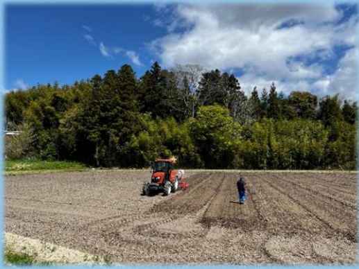
乾田直播の様子（富岡町）