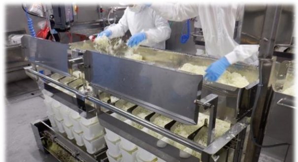
異物が混入していないか目視で確認を行い、出荷されます。