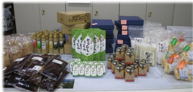
会津地方の 6次化商品