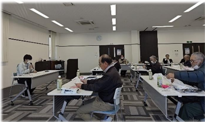
「ふたば地区稲作生産部会総会」の様子

令和6年3月27日（水）、JA 福島さくらふたば統括センター（富岡町）において、「令和5年度ふたば地区稲作生産部会」の総会が開催されました。近年は新型コロナの影響もあり、対面での開催が見送られていたため、平成30年度以来、5年ぶりの開催となりました。令和5年度は相