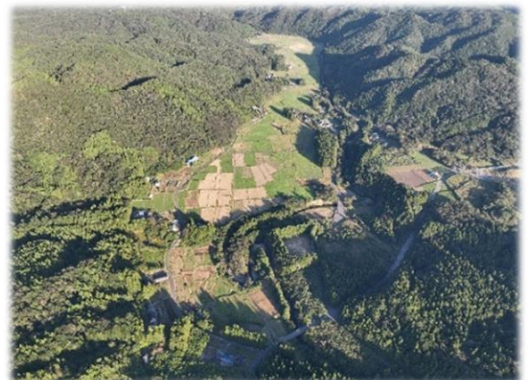
禧原地区全体の様子

禧原（じさばら）地区は、南相馬市鹿島区西部の中山間地域に位置し、二級河川真野川水系上真野川沿いに広がる水田地帯です。現在のほ場は、未整備の状態であることから 0.3ha 区画を整備し、担い手農家となる 1 法人に集積・集約することで、経営規模の拡大、営農にかかるコストの縮減を図る計画となっています。地元説明会を開催しながら工事に必要な測量や設計を進め、令和 6 年 1 月から工事に着手しました。工事範囲には、埋蔵文化財包蔵地が存在しているため、文化財保護の協議を進めながら、令和 8 年 3 月の農地整備完了を目指し、工事を進めてまいります。 [農村整備部]