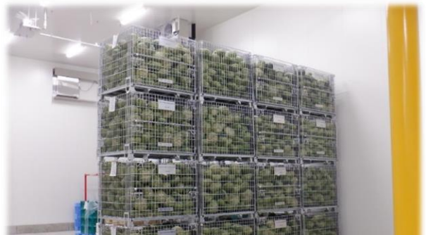
キャベツは保管庫で管理し、その日必要な分が加工されます。