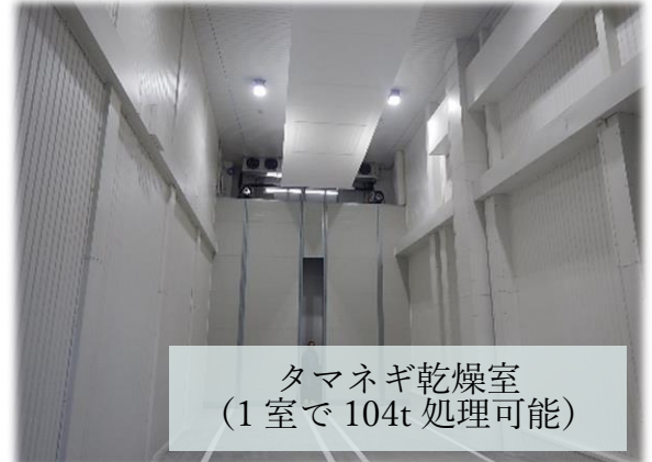
タマネギ乾燥室 (1室で104t処理可能)