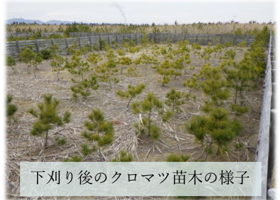
下刈り後のクロマツ苗木の様子

令和5年度は、相馬市及び南相馬市の海岸防災林において、森林整備活動に取り組んだ4件の申請があり認証しました。当所では、今後も企業・団体等による森林整備活動への参画を促進し、地球温暖化防止など森林の持つ多面的機能の持続的発揮と、山村地域の活性化に取り組んでいきます。 [森林林業部]