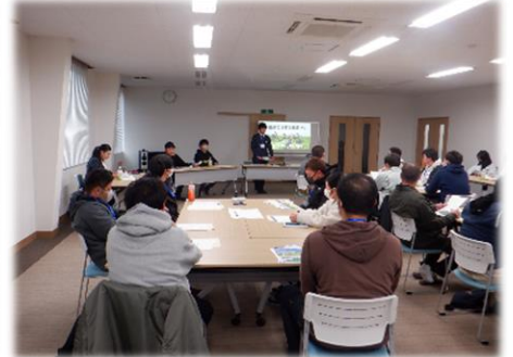
新規就農者交流会 令和 6 年 2 月 21 日 (水)