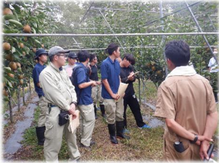
農短大生現地見学会 令和 5 年 9 月 15 日 (金)