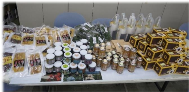
相双地方の 6次化商品