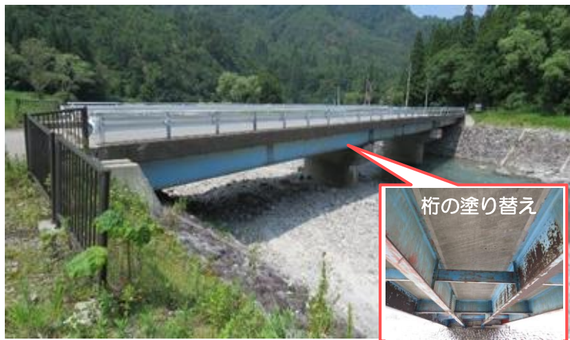
国道289号 中ノ平橋 (只見町)