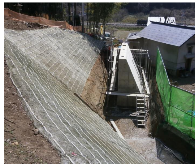
きたおもて 北表1号（郡山市）擁壁工