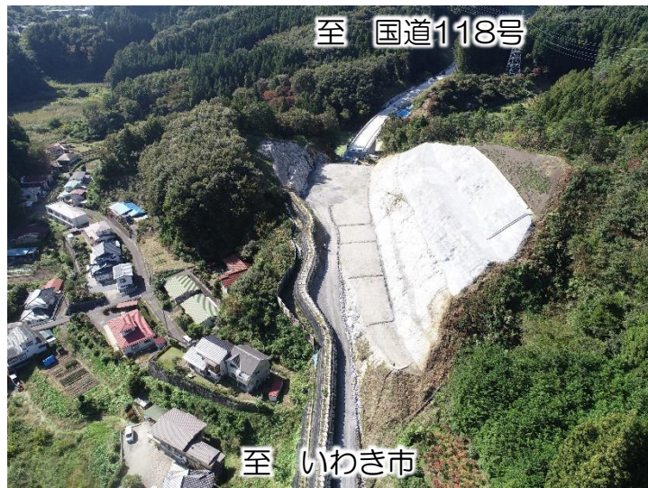
いわき石川線 石川BP1工区(石川町)