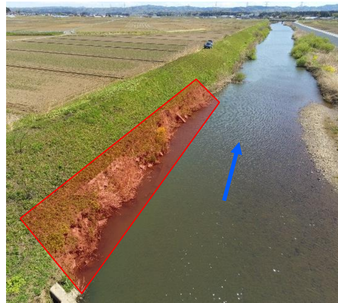
社川（棚倉町）護岸工（老朽化対策）