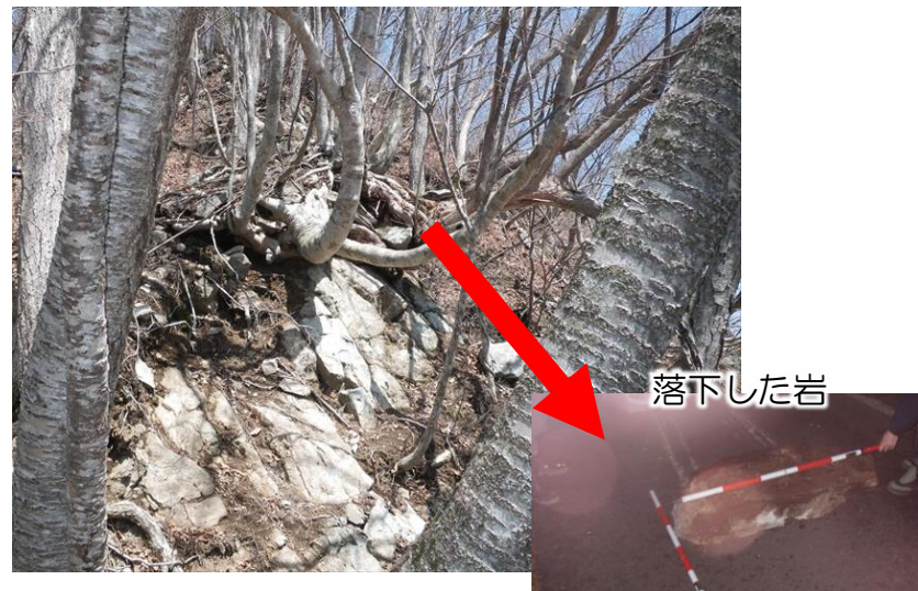
国道118号 小野岳工区(下郷町)