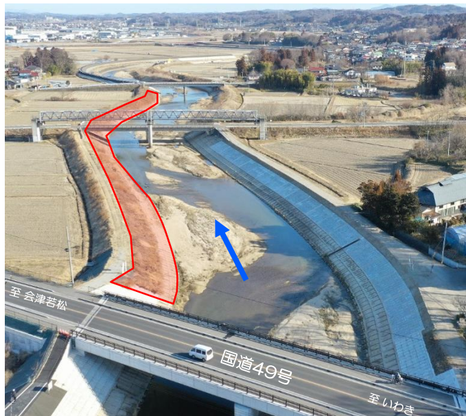
谷田川（郡山市）護岸工