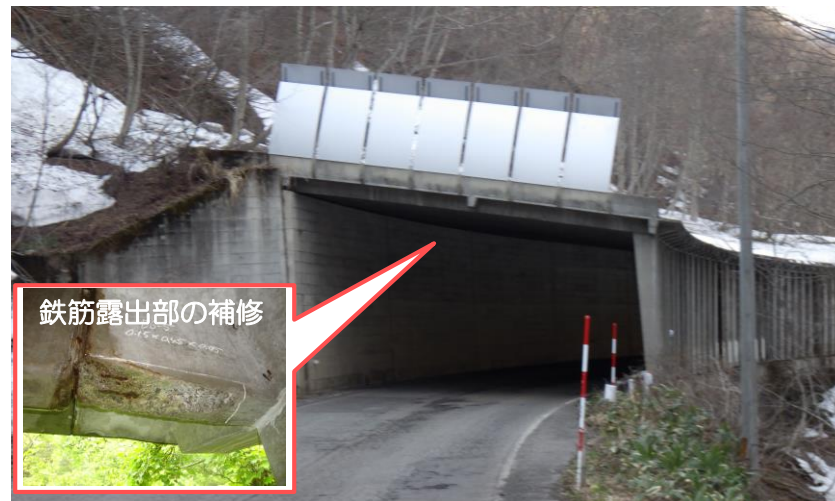
国道400号 小見沢スノーシェッド (昭和村)