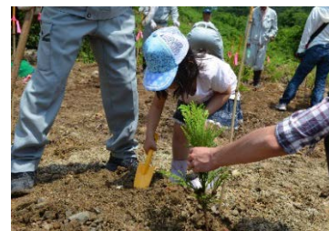
森林づくり活動での少花粉スギの植栽