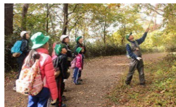
森林環境学習の実施