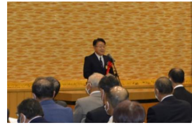
▲設立記念式典での星所長祝辞