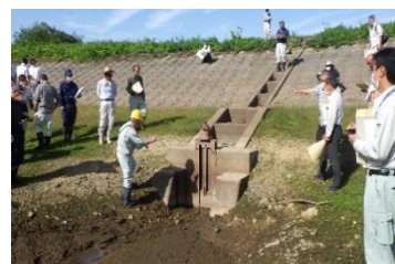
▲土砂吐ゲート点検方法を学ぶ参加者

ため池の管理や、劣化状況評価の判断についての質問が出されるなど、参加者にとって安全にため池を使用していくための知見を深めるよい機会となったようでした。 (農村整備部)