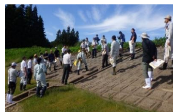
▲堤体の点検方法について説明を受ける様子