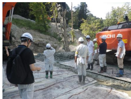
▲パワーブレンダーの見学

令和5年9月13日、農林土木事業を担当する会津農林事務所職員を対象に、地すべり防止工事に関する知識習得、技術力向上を目的とした研修会を開催しました。