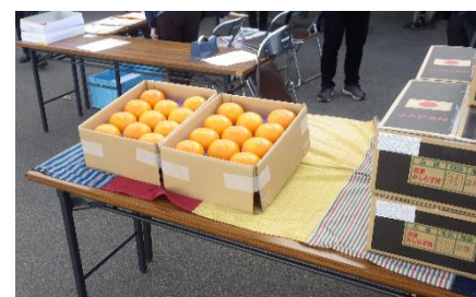
▲箱詰めされた「会津身不知柿」