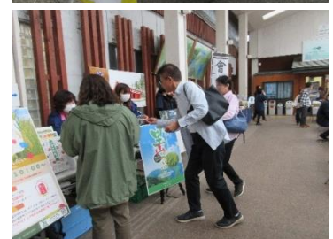
▲キャンペーンの様子