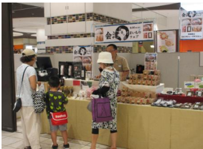
▲マーケティング調査会場の様子

令和5年8月24日～30日、マルイファミリー溝口（神奈川県川崎市）が主催する販売イベント「会津まるっと！うまいものフェア」に会津地域の6次化商品を出展させていただくのに合わせ、出展された5事業者19商品のマーケティング調査を行いました。