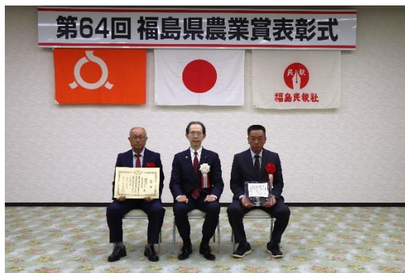
▲農事組合法人若宮グリーンファーム