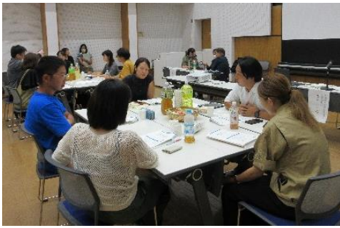
▲グループワークの様子