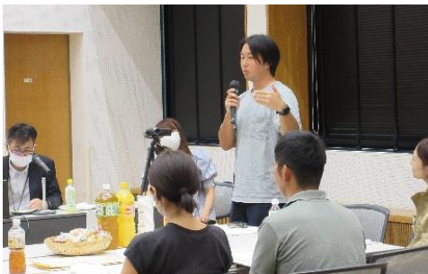
▲商品づくりのアイデアを プレゼンする参加者

令和5年7月20日と8月30日、9月6日の3日間に分けて、あいづ“まるごと”ネット第1回交流会を開催しました。