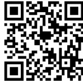
あいづ“まるごと”ネットX