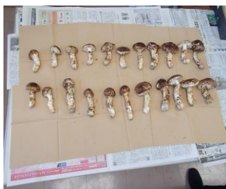
▲持ち込まれたマツタケ

関係者と連携しながら、来シーズンも品質の良いまつたけが出荷されるよう、引き続き支援してまいります。 (森林林業部)