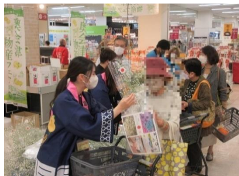
▲一定額以上購入された方へ昭和かすみ草をプレゼントしました

令和5年10月14日～15日にイオンいわき店において、10月20日～22日にはイオン福島店において、奥会津地域の農林水産物や6次化商品を販売する「奥会津物産フェア」を開催しました。