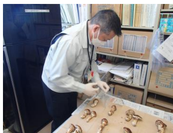
▲販売単位ごとに袋詰め