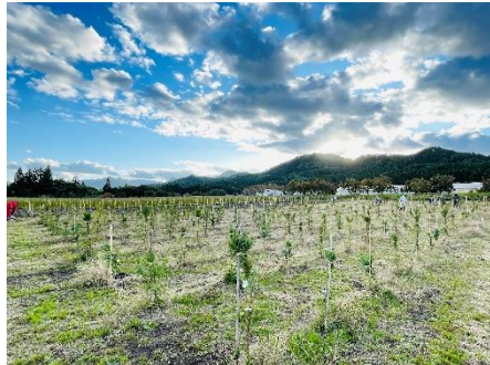
▲特定母樹採種園の様子

スギの花粉症は多くの人を悩ませる社会問題となっていますが、花粉量が一般的なものの半分以下で、成長量や剛性、通直性が従来のスギより優れている樹木を選抜して「特定母樹」とし、母樹から生産される種子等を活用したスギの生産拡大が進められています。