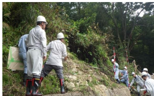
▲水路閉そく箇所の実地査定状況

会津北部と西部を中心に令和5年6月28日深夜から降り始めた雨は、西部で24時間降雨量が122mmを記録する豪雨となりました。