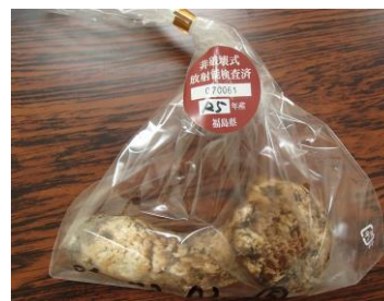
▲検査済シールが貼付された合格品