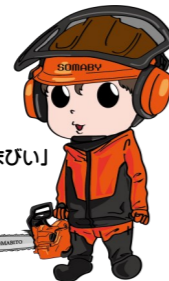
森の妖精「そまびい」