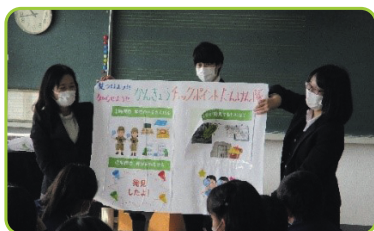
省エネに関するワークショップ