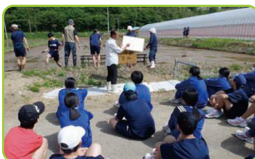
地域と連携した稲作体験活動