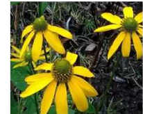
オオハンゴンソウ(外来種)