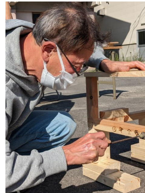
(実際にやきばんこを押していただく)