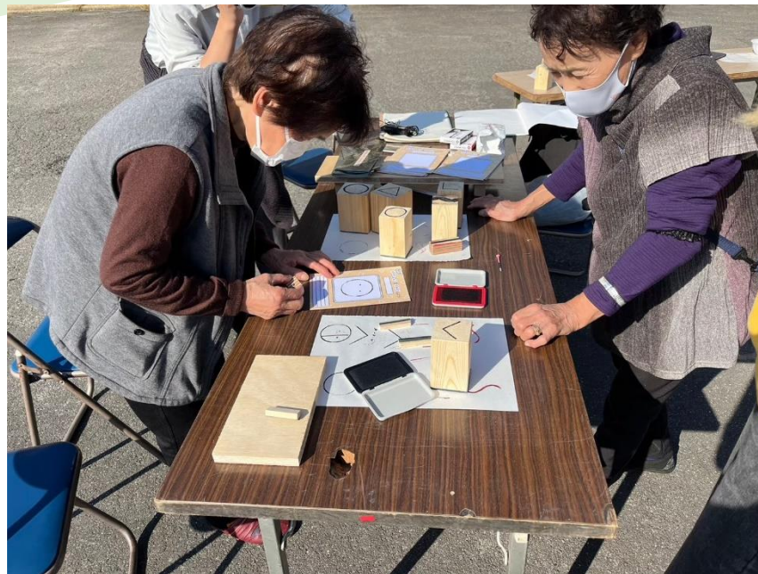
(やどりぎ案内が制作したハンコで、オリジナルやきばんこをデザイン)