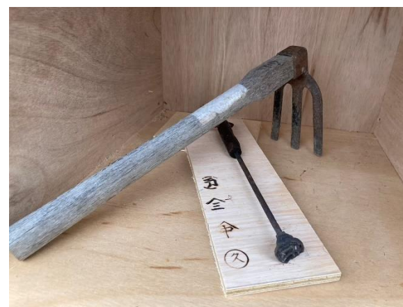
(「やきばんこ」と呼ばれる屋号紋の焼き印と、やきばんこが刻印された農具をしまい号に展示)