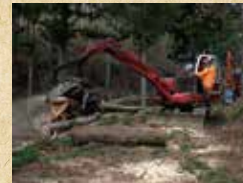
造材機械操作実習(プロセッサ)