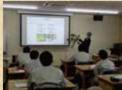
森林・林業の基礎