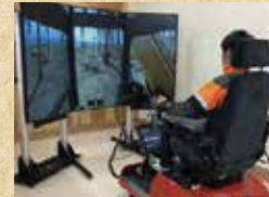
ハーベスタシミュレーター

ドローン操作、森林3次元計測システムによる森林調査、森林情報把握など、ICTを活用した先端林業技術、シミュレーターにより高性能林業機械の操作技術も学べます。