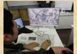
路網設計支援ソフト「FRD」