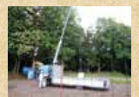
小型クレーン など