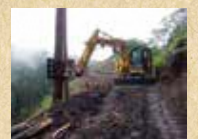
フェラーバンチャ