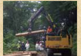
集材機械操作実習(フォワーダ)