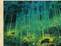
森林3次元計測システム「OWL」