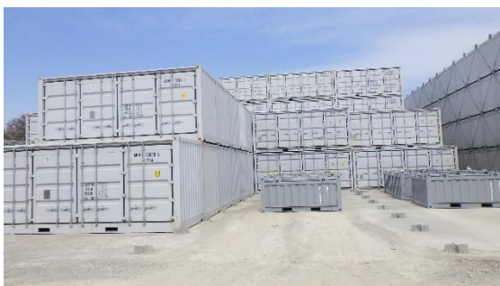
(写真6-1) 一時保管エリアP1のコンテナの状況①