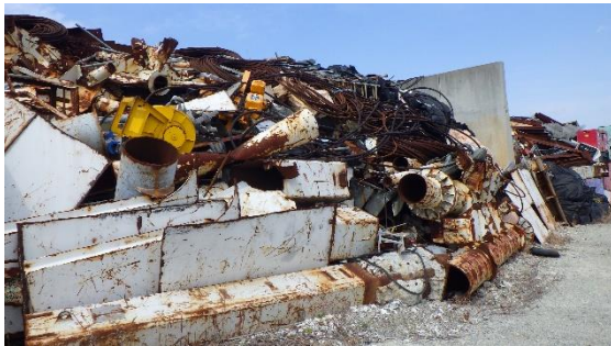
(写真5) 一時保管エリアP1の瓦礫類の状況