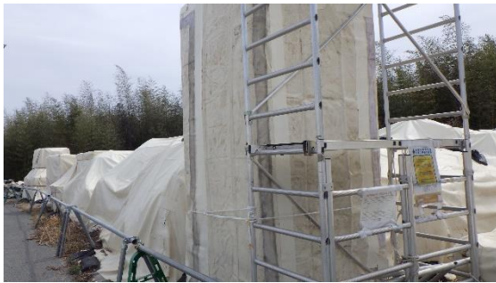
(写真4) 一時保管エリアE1のコンテナ及び瓦礫類の状況