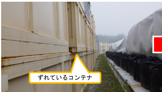
(写真2-1) 一時保管エリアCのコンテナの状況 (令和4年7月26日)