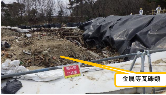
(写真3) 一時保管エリアCにおける「屋外一時保管エリアC解消に向けた試験施工」の状況