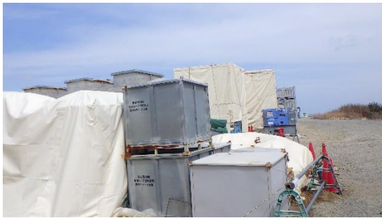
(写真6-3) 一時保管エリアP2のコンテナの状況①