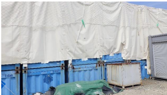
(写真6-4) 一時保管エリアP2のコンテナの状況②