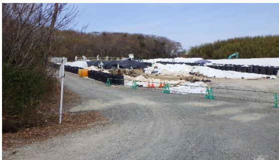
(写真1) 一時保管エリアCの状況