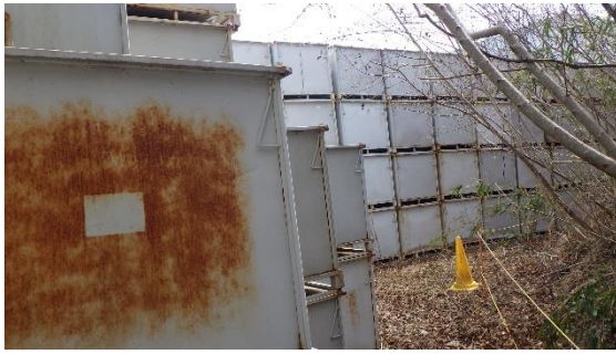
(写真6-2) 一時保管エリアP1のコンテナの状況②