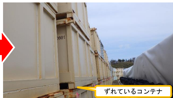
(写真2-2) 一時保管エリアCのコンテナの状況 (令和6年3月19日)