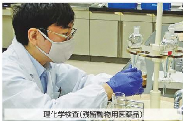
理化学検査(残留動物用医薬品)