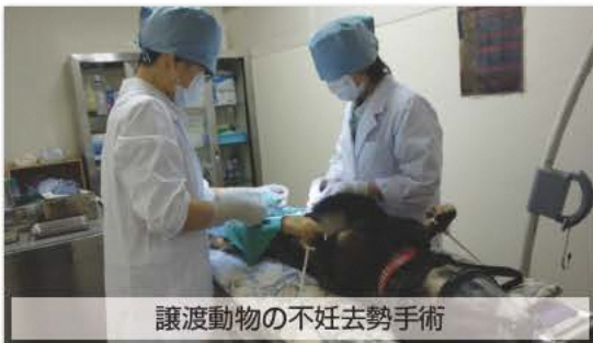
譲渡動物の不妊去勢手術