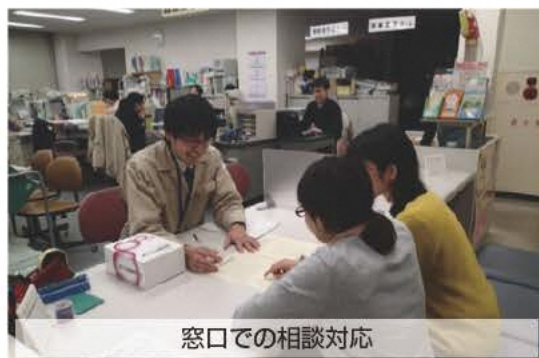
窓口での相談対応

会津保健福祉事務所及び相双保健福祉事務所には、動物愛護センターの支所があり、獣医師は兼務で動物愛護管理業務も行います。