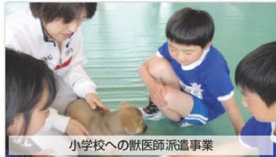
小学校への獣医師派遣事業