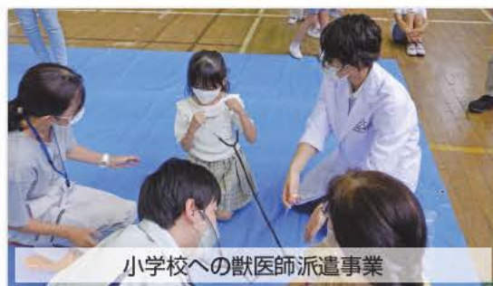
小学校への獣医師派遣事業