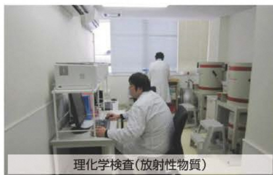
理化学検査(放射性物質)