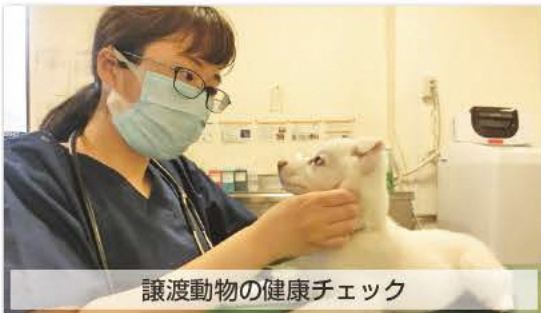
譲渡動物の健康チェック