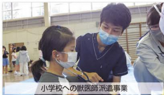
小学校への獣医師派遣事業