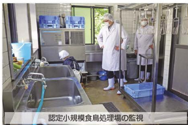
認定小規模食鳥処理場の監視