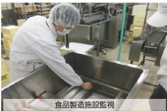
食品製造施設監視