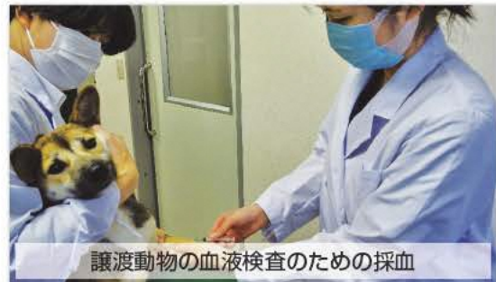
譲渡動物の血液検査のための採血