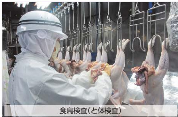
食鳥検査(と体検査)

また、2か所の認定小規模食鳥処理場に定期的に立入り、衛生的な食鳥処理について指導を行います。