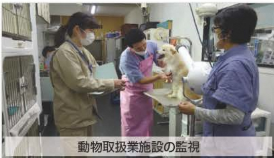
動物取扱業施設の監視