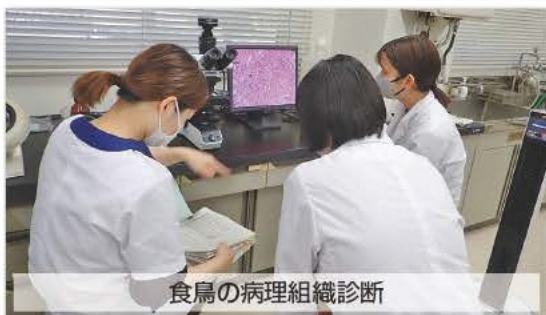
食鳥の病理組織診断