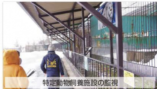
特定動物飼養施設の監視