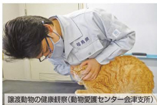
譲渡動物の健康観察(動物愛護センター会津支所)