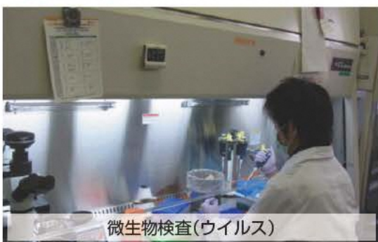
微生物検査(ウイルス)