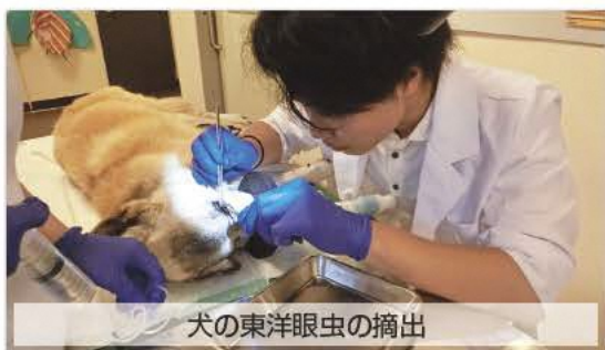
犬の東洋眼虫の摘出