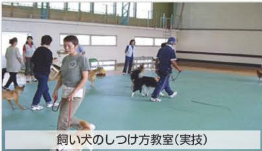
飼い犬のしつけ方教室(実技)