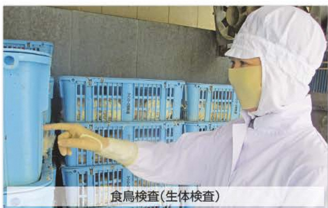
食鳥検査(生体検査)