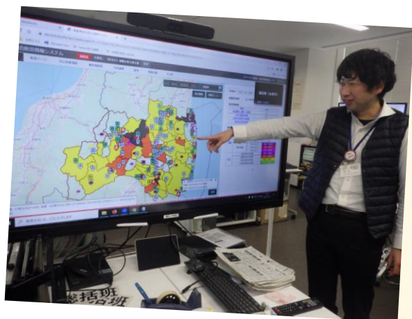
↑ 防災システムの説明中

大学卒業間近に東日本大震災が発生しました。大学卒業後は県外の民間企業へ就職する予定でしたが、実家が被災し福島県に戻ることを決断したことが志望のきっかけです。どうせ福島に戻るなら、福島の人たちの役に立つ職業に就きたいと考え、県職員を志望しました。