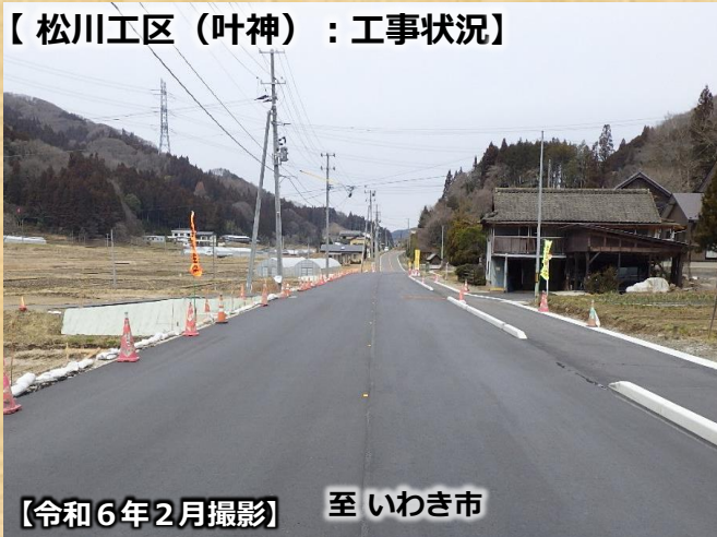
【松川工区（叶神）：工事状況】