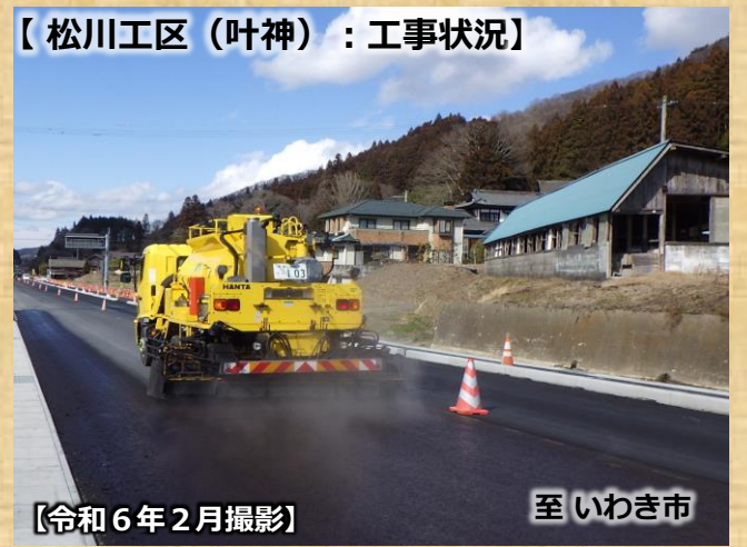
【松川工区（叶神）：工事状況】