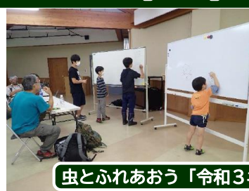
虫とふれあおう「令和3年度 虫や植物の観察会」