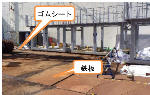
(写真 2 - 1) 高温焼却炉建屋東側地面の状況(2月8日撮影)