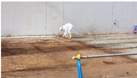
(写真 3 - 1) 線量測定の様子(地表面線量率)