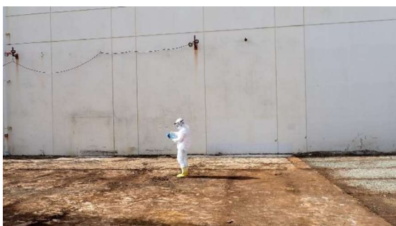
(写真 3 - 2) 線量測定の様子(空間線量率(高さ1 m))