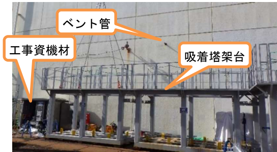
(写真 1 - 1) 高温焼却炉建屋東側の状況(2月8日撮影)