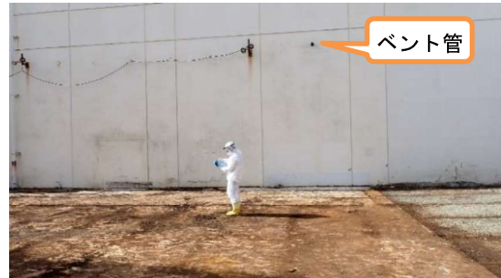
(写真 1 - 2) 高温焼却炉建屋東側の状況(2月9日撮影)