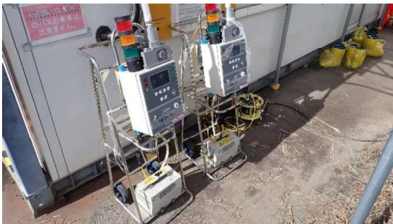
(写真5-2) ・作業エリア内のダスト濃度を測定しているダストモニタ (写真左)。 ・作業エリア境界の南側のダスト濃度を測定しているダストモニタ (写真右)。 ※ 高温焼却炉建屋南側に設置