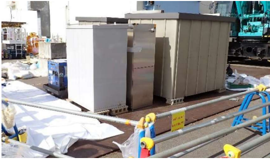
(写真4) 高温焼却炉建屋南東側に仮置かれていた工事資機材。