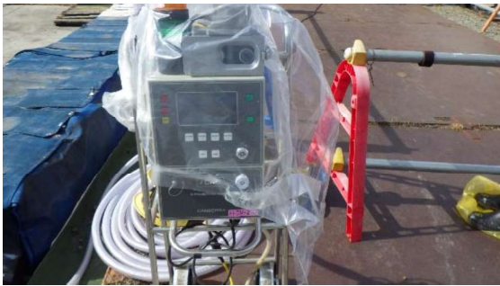
(写真5-1) 作業エリア境界の北側のダスト濃度を測定しているダストモニタ。 ※ 高温焼却炉建屋北東側に設置