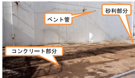
(写真 2 - 2) 高温焼却炉建屋東側地面の状況(2月9日撮影)