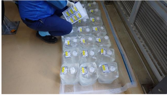
(写真3) 試料ラベル付けの状況