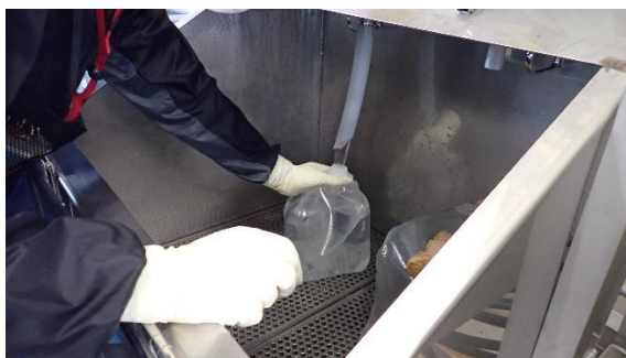
(写真1) 試料採取の状況