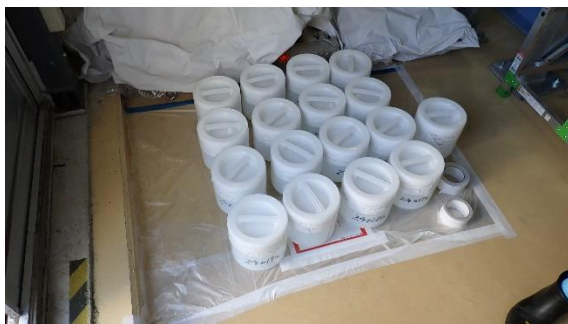
(写真2-1) 採取された試料の状況①