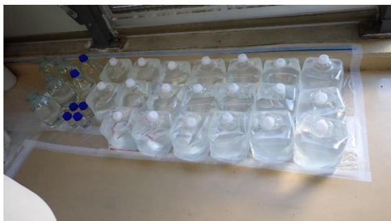
(写真2-2) 採取された試料の状況②