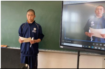
生徒会長から 全校生に向けたメッセージ

いじめを生み出さないようにしたいという思いを込めて、「撲滅」から「ゼロ」に言葉を変えました。