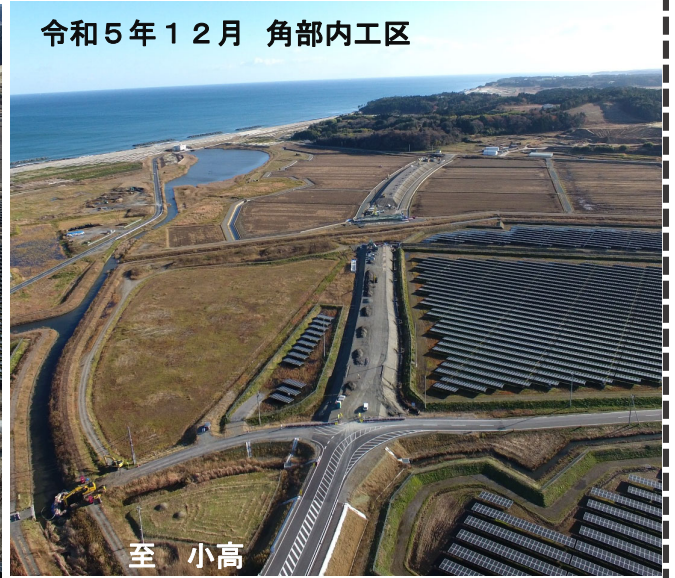
令和5年12月 角部内工区