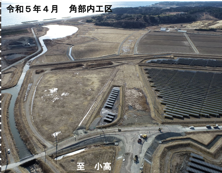
令和5年4月 角部内工区