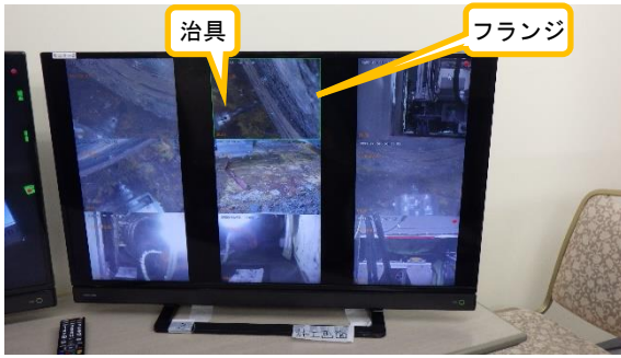
(写真2) 治具によるフランジ面の錆の除去作業の状況