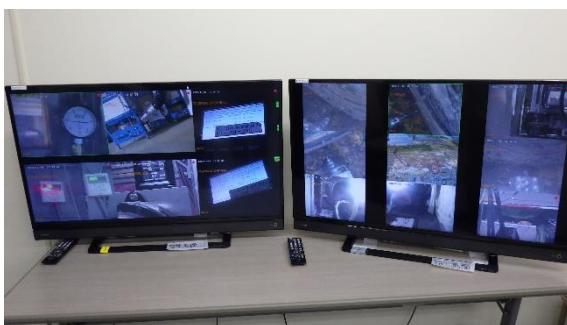
(写真1) 遠隔操作を監視するディスプレイ