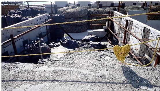
(写真 3) 防潮堤本体の状況 （4号機タービン建屋東側）