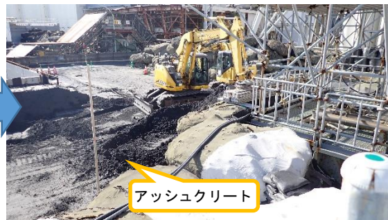
(写真 4 - 2) 防潮堤の構築作業状況 （4号機タービン建屋南側） （北側から撮影）