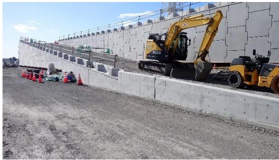
(写真 2 - 3) 防潮堤乗入道路（東側）の状況 （3号機タービン建屋東側） （北東側から撮影）