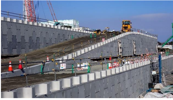
(写真 2 - 2) 防潮堤乗入道路（東側）の状況 （2号機タービン建屋東側） （南東側から撮影）