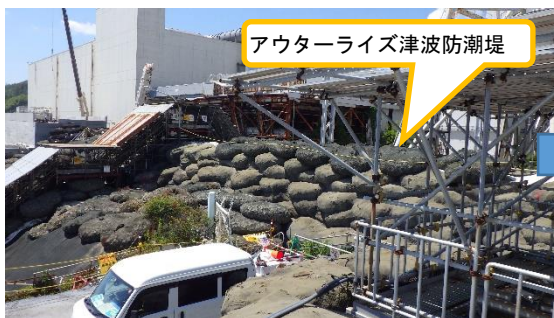
(写真 4 - 1) 防潮堤の状況（令和 5 年 8 月 2 日） （4号機タービン建屋南側） （北側から撮影）