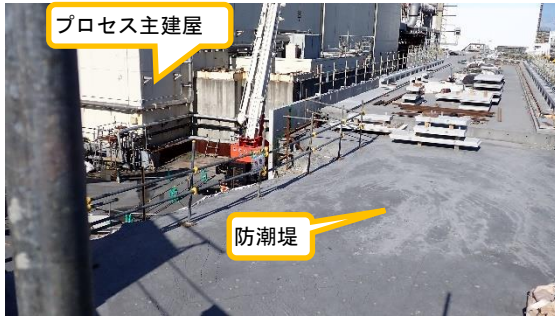
(写真 5 - 1) 防潮堤の状況 (プロセス主建屋東側) (南側から撮影)