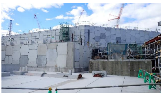
(写真2-1) 防潮堤の状況 (1号機タービン建屋東側) (東側から撮影)