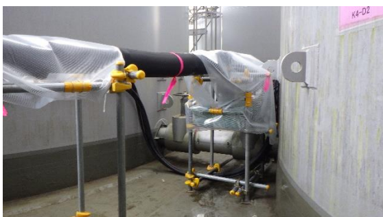
(写真4-3) K4タンクエリア堰内の仮設移送配 管（耐圧ホース+サニーホース+保 温材）の状況