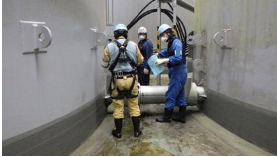
(写真 2 - 1) 系統構成確認作業の状況① (測定・確認用タンク B 群タンク連 結管の弁状態確認状況)