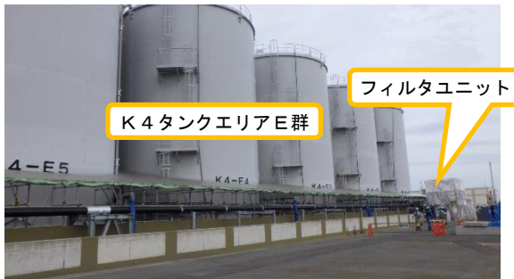
(写真1-1) K4タンクエリアE群概観 (南西側から撮影)