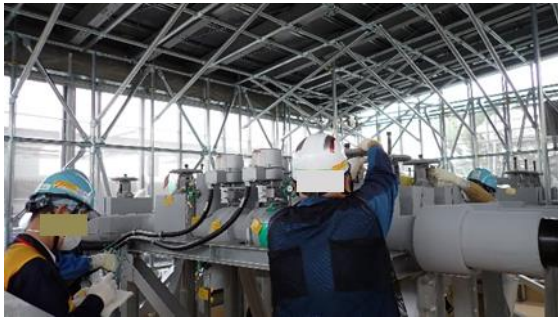
(写真 2 - 2) 系統構成確認作業の状況② (測定・確認用タンク A 群のサンプ ルタンク受入二次弁後弁の「全 閉」操作の状況)