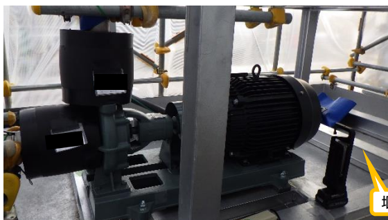
(写真4-1) ポンプの状況