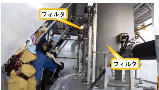
(写真4-2) フィルタの確認状況