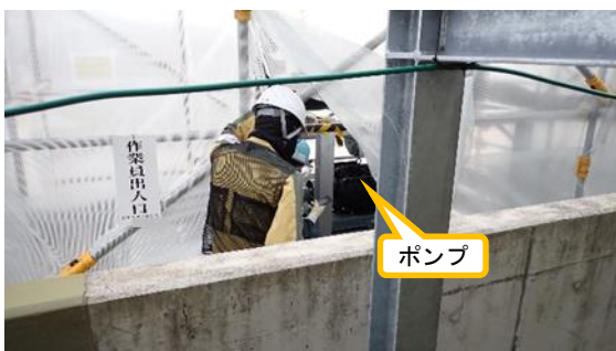
(写真 3 - 2) ポンプ稼働時の確認状況