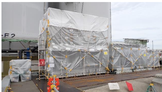
(写真1-2) フィルタユニットの外観 (南側から撮影)