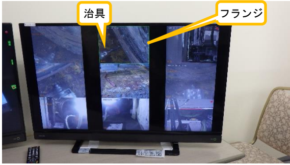
(写真2) 治具によるフランジ面の錆の除去作業の状況