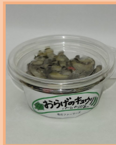
亀石ファーマーズ