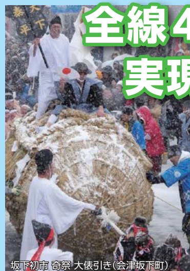
坂下初市 奇祭 大俵引き(会津坂下町)