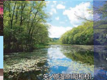
矢ノ原湿原(昭和村)