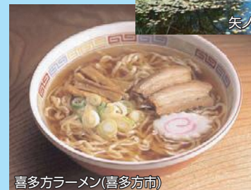
喜多方ラーメン(喜多方市)