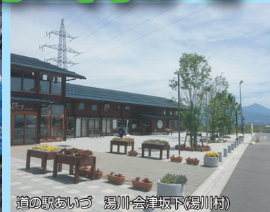
道の駅あいづ 湯川会津坂下(湯川村)

東北横断自動車道いわき新潟線建設促進期成同盟会 福島県東北横断自動車道建設促進期成同盟会