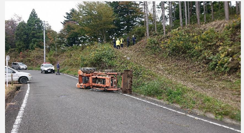
怖いぞ転落、踏み外し！