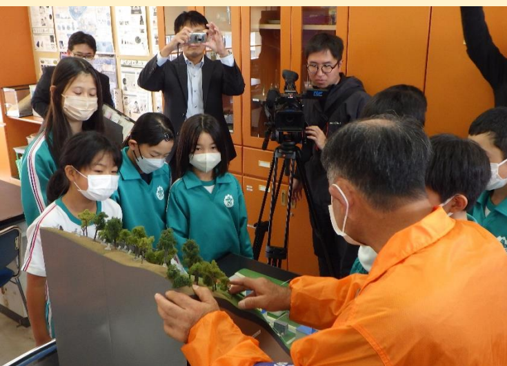
がけ崩れの模型を使って説明する様子