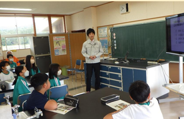
洪水や土砂災害の危険性について説明する様子