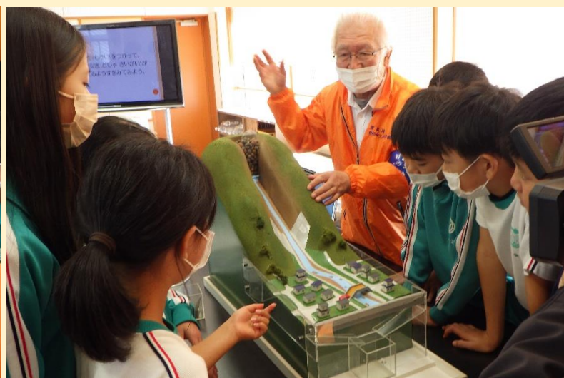
土石流の模型を使って説明する様子

近年、地球温暖化に伴う局地的集中豪雨など、洪水や土砂災害により、多くの尊い命が失われています。