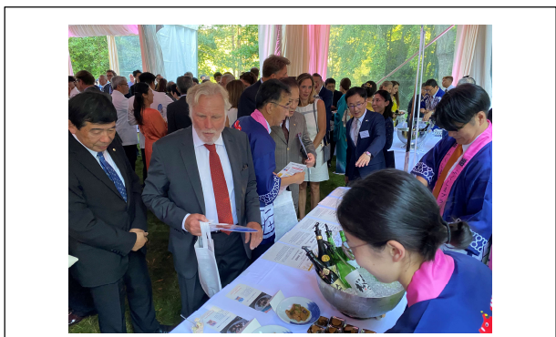
パーティ中の福島県ブースの様子③