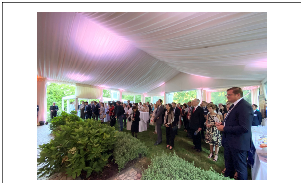
知事のメッセージを聞く参加者