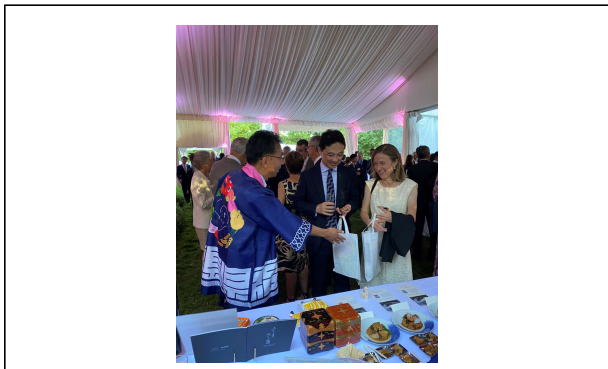
パーティ中の福島県ブースの様子②