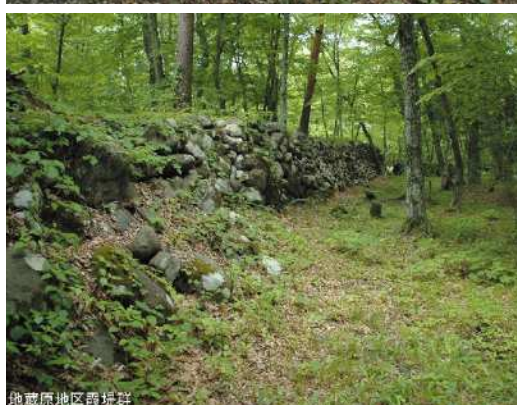
地蔵原地区霞堤群