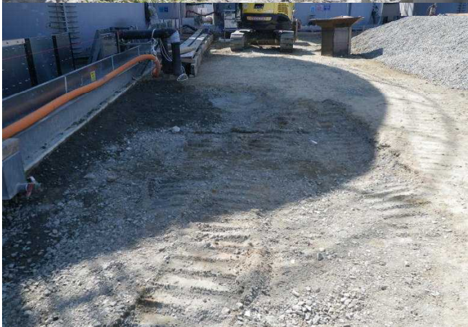
土壌回収状況 （完了）