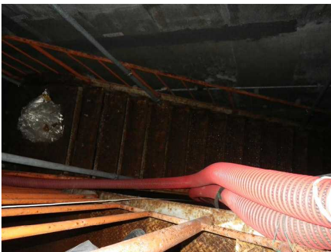
地下階への階段 超音波水位計により水位測定