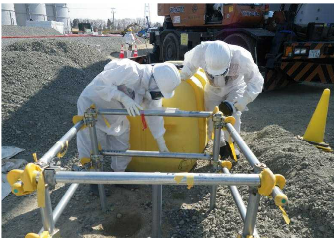
漏洩したプラスチックタンクと漏洩部