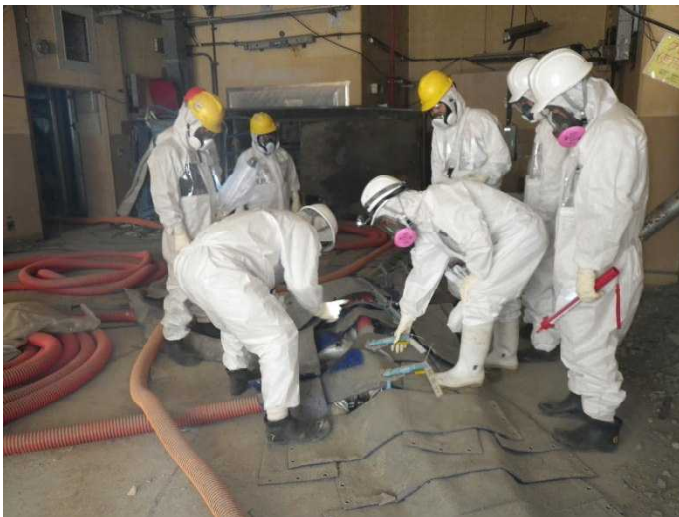
焼却工作建屋移送配管