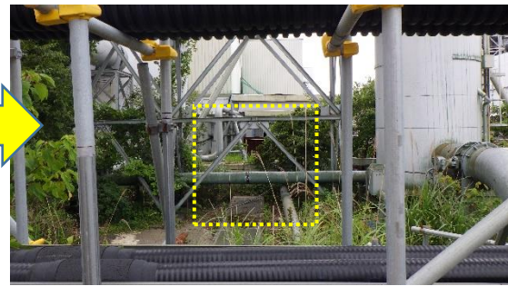
(写真1-2) 同左 (令和5年7月14日撮影)