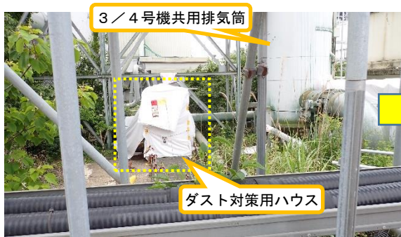
(写真1-1) 3/4号機共用排気筒北側の状況 (令和5年6月27日撮影)