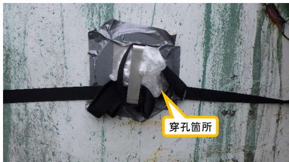
(写真2-1) 穿孔箇所① 閉止蓋で封じられており、ベルトが巻かれている。 (北西側から撮影)