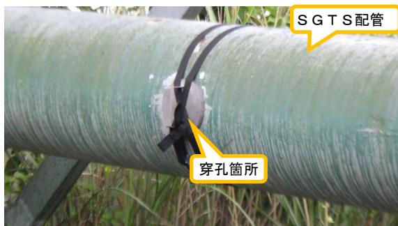
(写真2-2) 穿孔箇所② 閉止蓋で封じられており、ベルトが巻かれている。 (北西側から撮影)